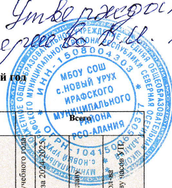
ГРАФИК оценочных процедур на 2024-2025 учебный год НАЧАЛЬНОЕ ОБЩЕЕ ОБРАЗОВАНИЕ II полугодие